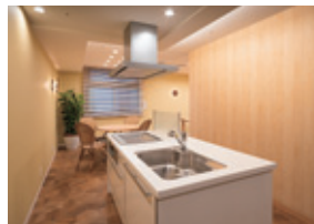
オープンキッチン