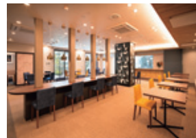
メインダイニング