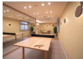
アクティブスペース