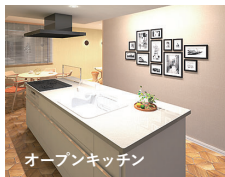
オープンキッチン