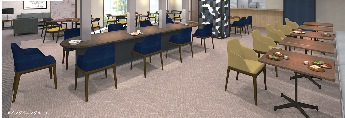
メインダイニングルーム